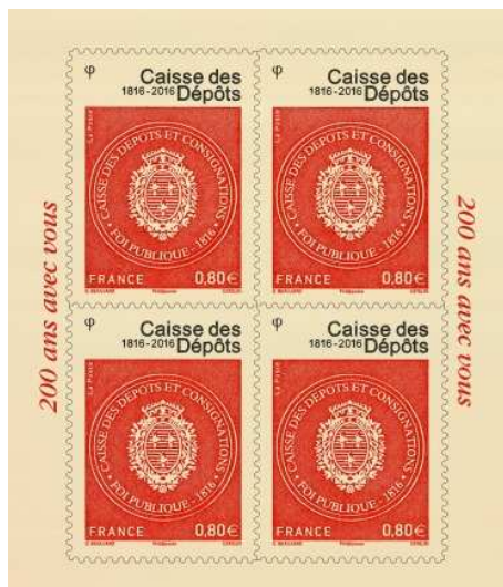
Le bloc de 4 timbres imprimé en taille-douce sur support bio-sourcé 20 000 exemplaires