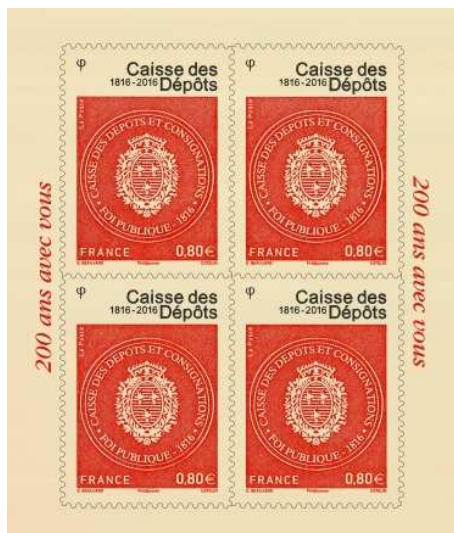
Le bloc de 4 timbres imprimé en taille-douce sur support bio-sourcé 20 000 exemplaires